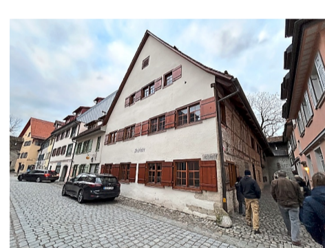
Das altherwürdige Badhaus in der Lange Gasse zählt zu den Juwelen der Wangener Museumslandschaft.

In der Herrengasse und auf anderen Plätzen in der Altstadt ist immer am Mittwochmorgen Wochenmarkt mit mehr als 70 Ständen. „Das ist eine ganz besondere Atmosphäre“, gerät Herz geradezu ins Schwärmen. Die Gästeführerin ist eine perfekte Botschafterin von Wangen. Mit Freude und Begeisterung versteht sie es, den Gästen die Besonderheiten der 27 000 Einwohner zählenden Großen Kreisstadt zu zeigen. „Sollen wir noch beim Fidelisbäck vorbeischauen“, fragt sie am Ende der Tour in die Runde. Die Mehrzahl der Teilnehmer winkt ab. „Dort waren wir schon als Kinder, weil unser Vater immer auf dem Weg in den Skiurlaub in Wangen beim Fidelisbäck an-