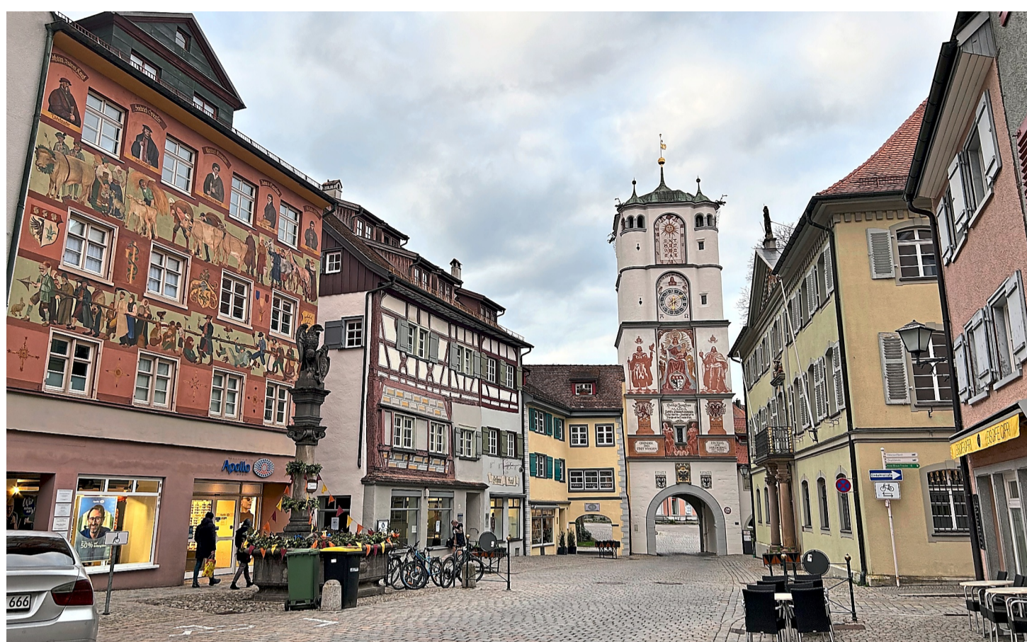
In den 1970er-Jahren hat man in Wangen erkannt, dass das Erscheinungsbild der denkmalgeschützten Altstadt mit den Stadttoren erhalten werden muss.

An der Stadtmauer am Argenufer, nahe dem Badstubengebäude, steht der Badstuben- oder Kopfwäschebrunnen. Die Brunnenplastik wurde 1993 von Gisela Steinmle aus Bad Urach geschaffen. „In fröhlichem